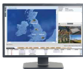
Centro di Controllo