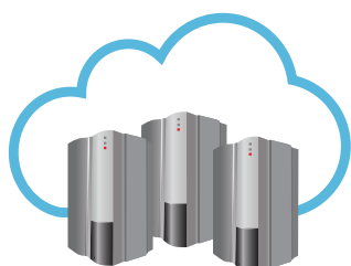
Server RISCO Cloud

ProSYS™ Plus è stata progettata considerando fondamentale l'affidabilità dei sistemi di comunicazione. Non solo permette di utilizzare tutte le più avanzate tecnologie di comunicazione disponibili come multi-socket IP, 3G e WiFi ma anche consente di configurare più canali contemporaneamente ottenendo piena ridondanza e resilienza.