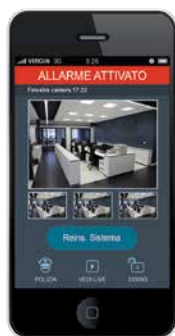
Controllo via App

La connessione alla centrale può avvenire localmente tramite un cavetto standard, o da remoto via GPRS o IP. Connettendosi al Cloud RISCO, l'installatore può programmare da qualsiasi luogo utilizzando una semplice connessione ad Internet.